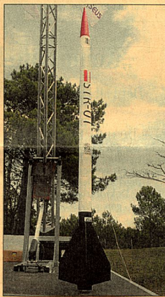
Zwei Semester Arbeit kurz vor dem Abflug.

Dussel gibt sich kämpferisch: „Wir kommen ja wieder.“ Für die Zukunft wünscht er sich, das Projekt noch mehr in Richtung Plattform zu lenken. „Das Team soll eine Möglichkeit für Studierende unterschiedlichster Studienrichtungen bieten, ihre Ideen zum Thema Luft- und Raumfahrt zu verwirklichen.“ (lhag)